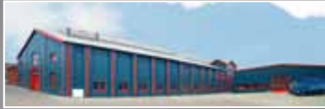
Die HIRO LIFT Fertigungshalle in Bielefeld